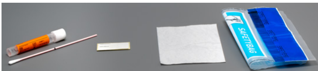
buisje en wattenstaafje